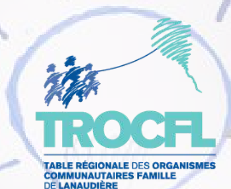
Table régionale des organismes communautaires Famille de Lanaudière 15, rue Monday, Saint-Gabriel, Qc, J0K 2N0 450-586-0733 info@trocfl.org www.facebook.com/trocfl www.trocfl.org