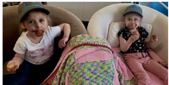
Les enfants ont bien apprécié !!