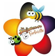
La Joujouthèque Farfouille Joliette