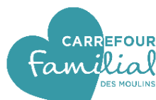
Carrefour familial des Moulins Terrebonne