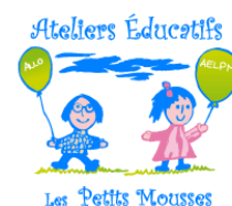
Les Ateliers éducatifs Les Petits Mousse Joliette