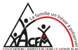
Association Carrefour Famille Montcalm Saint-Lin-Laurentides