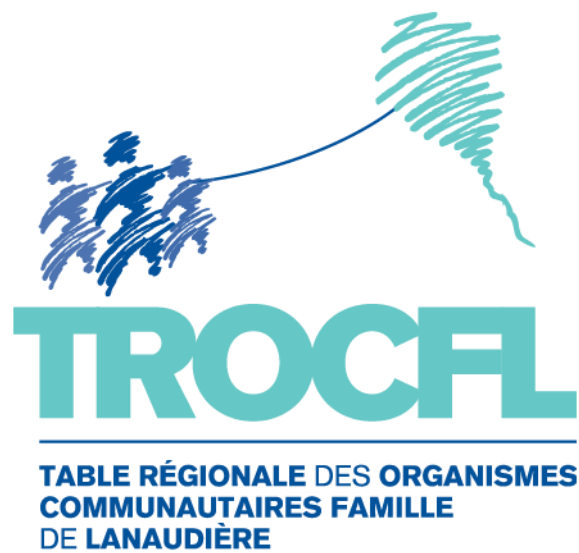
Table régionale des organismes communautaires Famille de Lanaudière 15, rue Monday, Saint-Gabriel, Qc, J0K 2N0 450-835-9094 info@trocfl.org www.facebook.com/trocfl www.trocfl.org