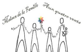
Maison de la Famille Aux quatre vents Berthierville