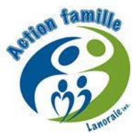
Action Famille Lanoraie Lanoraie