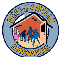
Défi-Famille Matawinie St-Jean-de-Matha