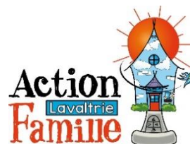
Action Famille Lavaltrie Lavaltrie