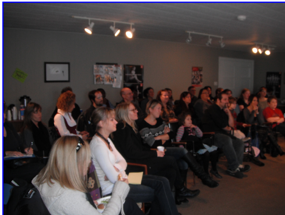
Table Régionale des Organismes Communautaires Famille de Lanaudière (TROCF)